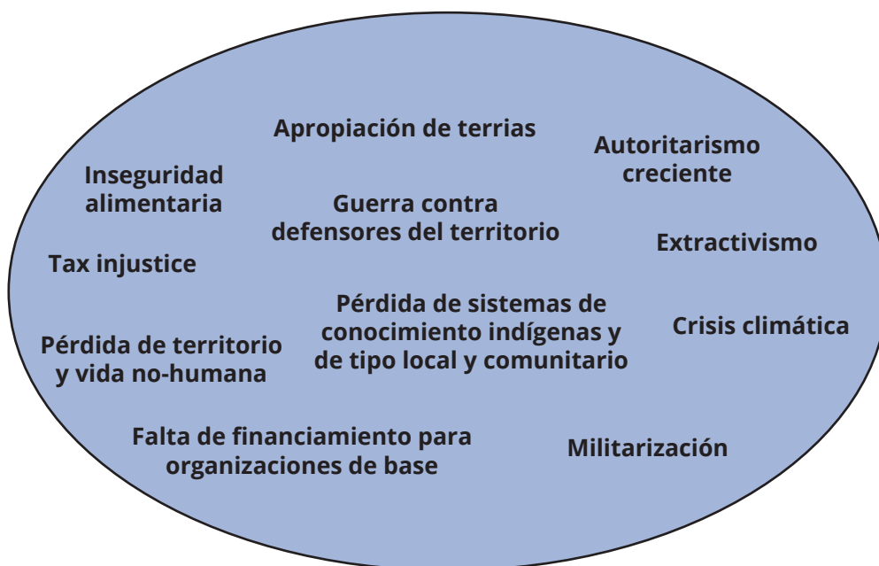
Figura 1: Diferentes caras de la policrisis articuladas por los miembros de la Asamblea de el TGA en Kenia, 2023